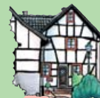
10. Fachwerkwinkelhofanlage Martinusstraße