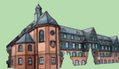
12. Altes Kloster