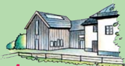
1. Naturschutzzentrum und Bauerngarten