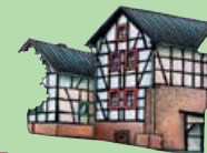
6. Alte Schule