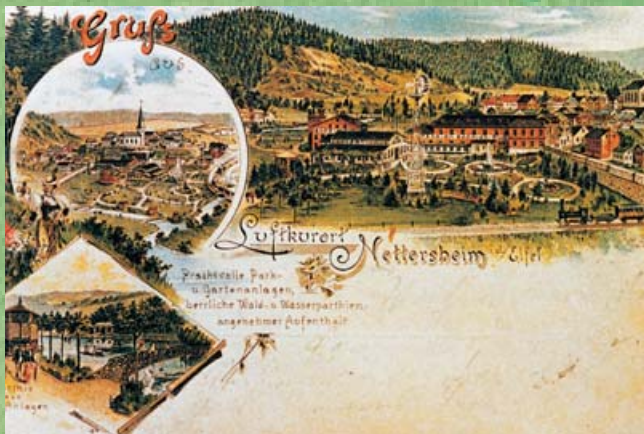
Postkarte mit Ansicht der Kneipp'schen Kuranstalt, um 1900

Als eines der wenigen Eifeldörfer besaß Nettersheim ehemals drei Burganlagen. Nachdem Nettersheim 1871 an die Bahnlinie Köln - Trier angeschlossen worden war, erlebte der Ort um 1900 eine kurze Blüte als Kneipp'sches Kurbad.