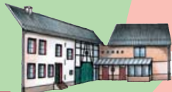
17. Hofanlage Steinfelder Straße 2 mit Anbauten, Geschäftshaus