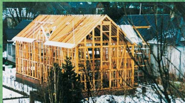
Holzkonstruktion, Anbau Naturschutzzentrum Eifel

Die behutsam restaurierte historische Bausubstanz spiegelt die traditionelle Wohn- und Wirtschaftsweise der Dorfbewohner wider. Das Dorfbild wird geprägt durch ehemals landwirtschaftlich genutzte Fachwerk- und Bruchsteinbauten. Typische Bauform ist die Winkelhofanlage aus Wohnhaus und im Winkel dazu angeordnetem Stall- und Scheunentrakt.