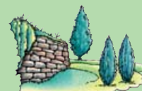
11. Alter Friedhof