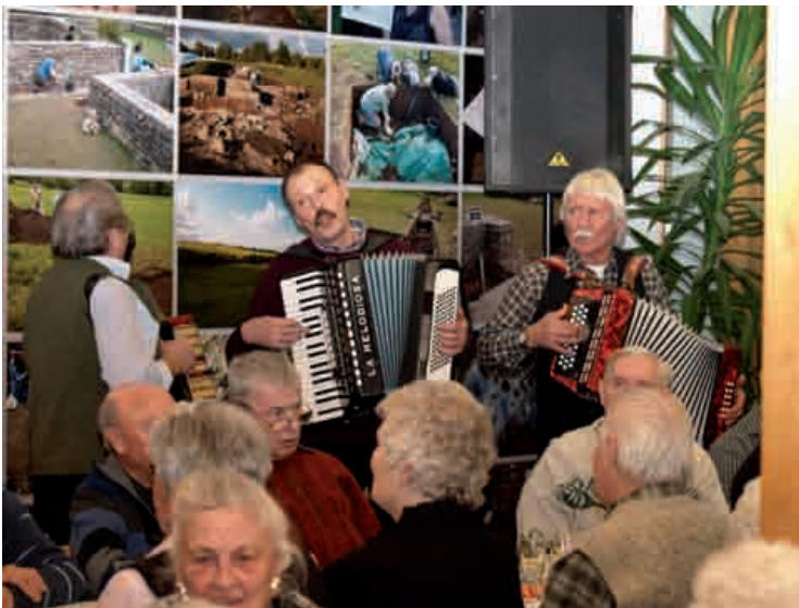
Die „Männ met der Quetsch“ aus Marmagen waren natürlich auch wieder dabei