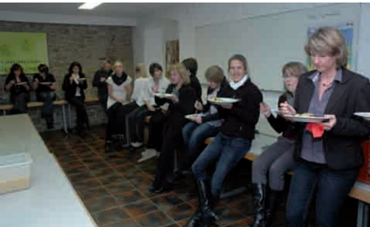
Guten Appetit dem Helferteam - Ohne sie - keine Feier möglich - Danke Euch allen