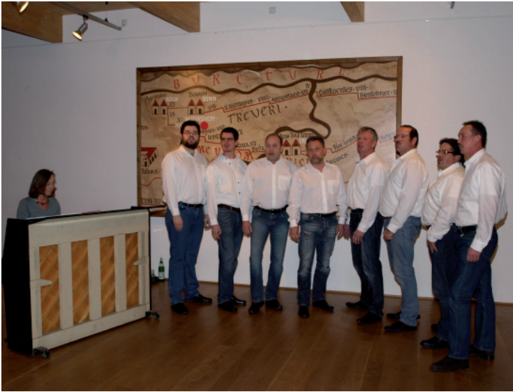
Der Männerchor „Hätzbloot“ aus Mutscheid begeisterte mit tollem Gesang