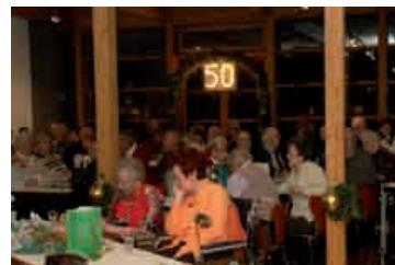
33 Gold- und Diamantpaare haben sich mit uns gefreut