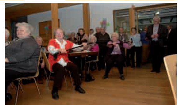
Und unsere Gäste machten mit, ein wahrer Jungbrunnen tat sich auf. Sport und Bewegung - auch mit Gehstock -