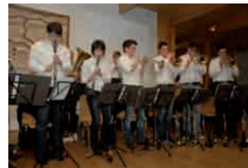
Die neue Musikkapelle Eifelgold spielte „goldig“ auf. Nur junge Musiker - toll