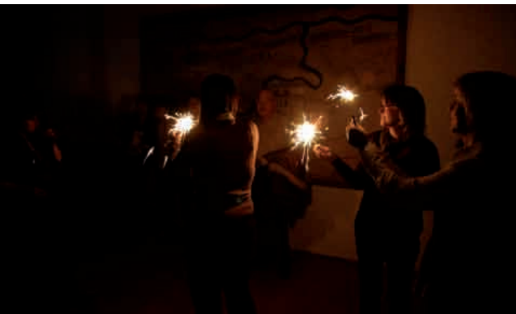
Nochmals ein gutes neues Jahr, vor allem Gesundheit und Zufriedenheit. Wir freuen uns bereits heute auf „SeniorenSilvester 2012“