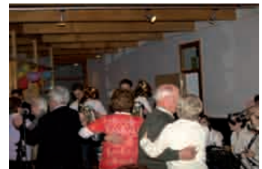
Hatten wir bisher noch nicht - es wurde sogar getanzt