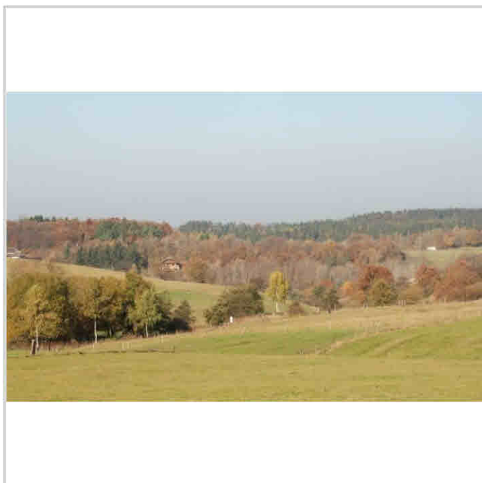
Blick zur Alte Burg