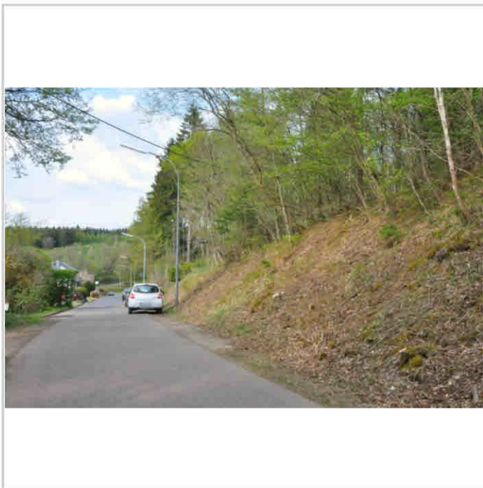
Zufahrt zum Grundstück