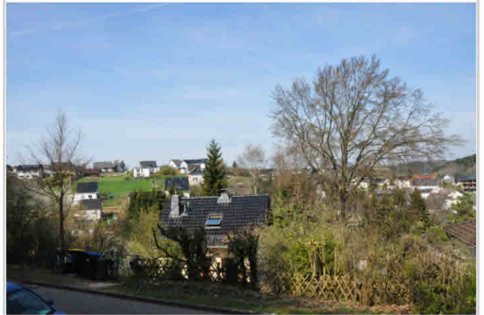
Ihr zukünftiger Ausblick