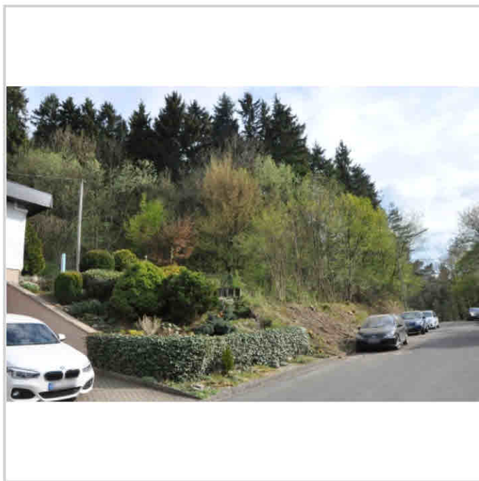
Blick zum Grundstück

haftet nicht für Irrtümer oder Schreibfehler. Das Exposé dient als Vorinformation. Als Rechtsgrundlage gilt allein der notariell abgeschlossene Kaufvertrag. Änderungen und Zwischenverkauf vorbehalten.