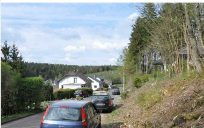
Blick vom Grundstück aus