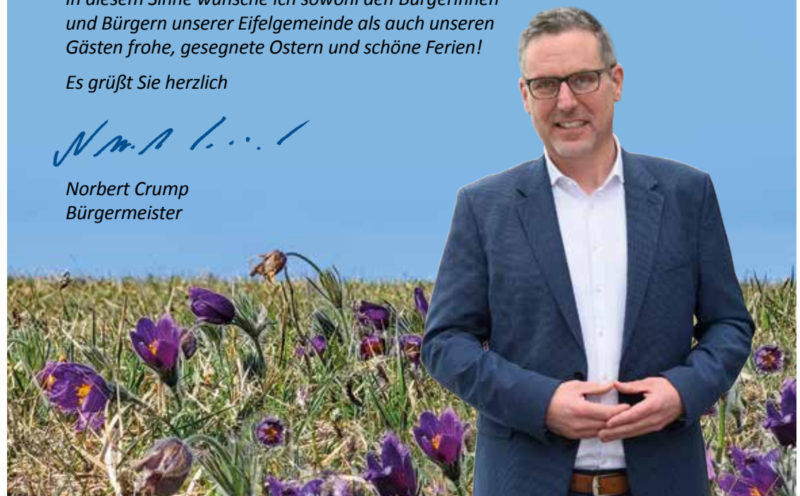
Norbert Crump Bürgermeister