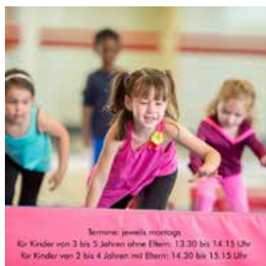
Termine: jeweils montags für Kinder von 3 bis 5 Jahren ohne Eltern: 13.30 bis 14.15 Uhr für Kinder von 2 bis 4 Jahren mit Eltern: 14.30 bis 15.15 Uhr

für Kinder von 2 bis 4 Jahren mit Eltern: 14.30 bis 15.15 Uhr